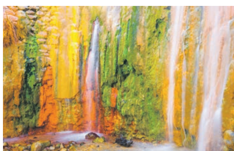
Cascada de Cores im Nationalpark: Caldera de Taburiente