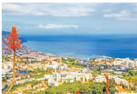
Funchal / Madeira