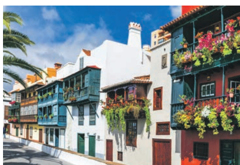
Santa Cruz de Tenerife / Teneriffa