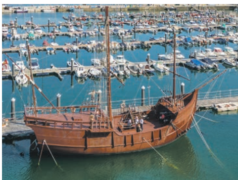
Baiona - „Pinta“ im Hafen

le Steinhäuser aus dem 18. Jahrhundert bieten schöne Fotomotive, aufgewertet durch hübsche Arkaden oder elegante Balkone. Kulinarische Leckerbissen erwarten Sie im Fischerviertel 'Berbés', wo Austern als Spezialität gelten – und wo auch eine Austerngasse angesiedelt ist. Einen Besuch wert ist Baiona: Um nach der Rückkehr aus Amerika die „Entdeckung der Neuen Welt“ zu verkünden, legte hier im März 1493 die „Pinta“ an – eines der drei Schiffe, mit denen Christoph Kolumbus auf seine erste Seereise aufbrach. Ein Nachbau des Schiffs, das auch eine Ausstellung beherbergt, kann im Hafen besichtigt werden. Naturfreunde sind auf den Cíes-Inseln richtig. Und wer auf Wallfahrt gehen möchte, macht einen optionalen Ausflug nach Santiago de Compostela.