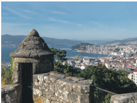
Vigo / Spanien

Auf dieser erlebnisreichen Kreuzfahrt mit der MS Vasco da Gama kommen sowohl Kultur- als auch Naturliebhaber voll auf ihre Kosten. Erkunden Sie das spanische Vigo mit seiner faszinierenden Altstadt Casco Vello und sammeln Sie unvergessliche Eindrücke im portugiesischen Lissabon. Auf der Blumeninsel Madeira flanieren Sie durch den exotischen botanischen Garten und entdecken die üppige Natur. Beeindruckende Naturwanderungen erwarten Sie auch auf La Palma, wo Sie das UNESCO-Biosphärenreservat Los Tilos sowie der riesige Vulkankrater im Nationalpark begeistern werden.