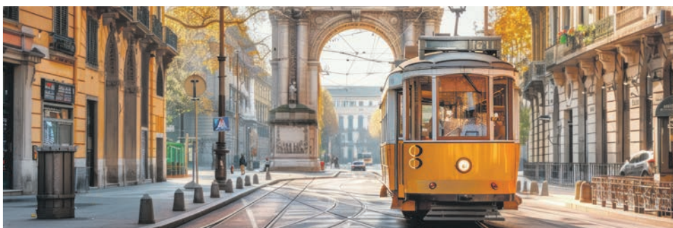
Lissabon - 'Linie 28'