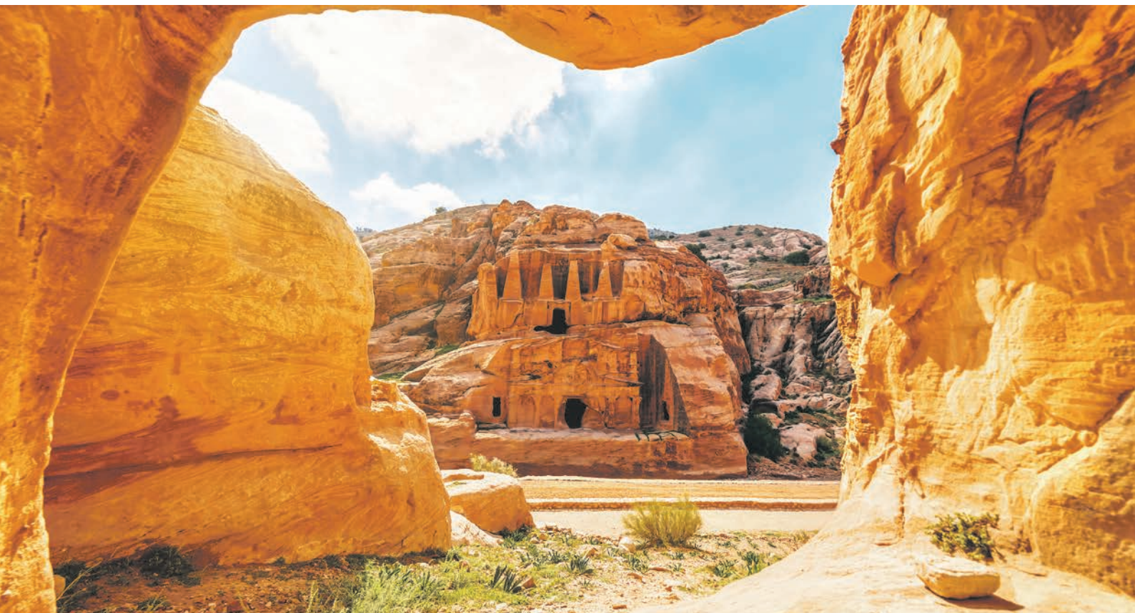
Felsenstadt Petra / Jordanien