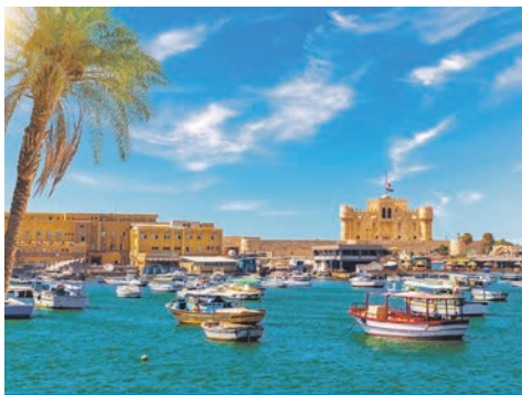
Alexandria / Ägypten