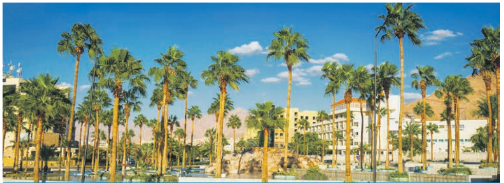
Aqaba / Jordanien