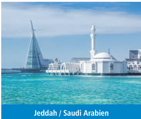
Jeddah / Saudi Arabien

Oman – Saudi-Arabien – Ägypten – Jordanien – Suezkanal – Griechenland