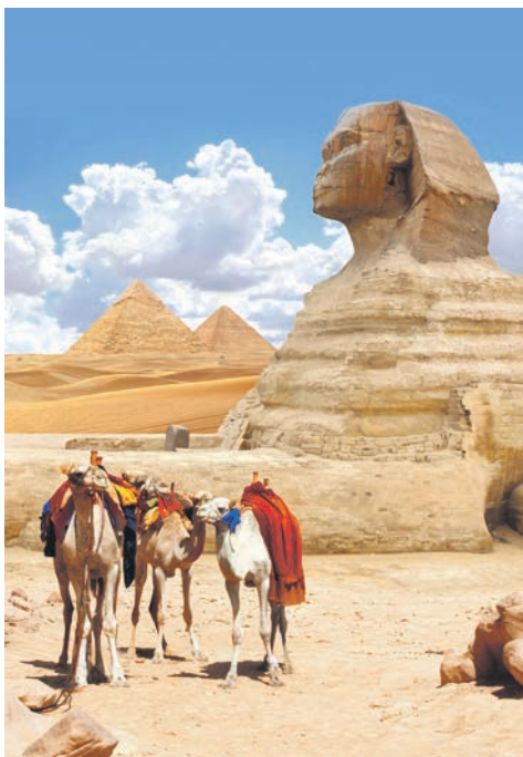
Pyramiden von Gizeh / Ägypten

Luxor dem Falkengott Horus ins 'Tal der Könige' und besuchen Sie den beeindruckenden 'Totentempel der Hatschepsut', der Sie in das Reich des Osiris versetzt. Alternativ bieten die bezaubernden Korallenriffe in der 'Soma-Bucht' ein wahres Paradies für Liebhaber der Unterwasserwelt (optional).