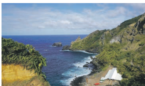
Bounty Bay / Pitcairninnseln