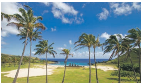
Ahu Tongariki / Osterinsel

Chile – Osterinsel – Pitcairninnseln – Tuamotu-Archipel – Moorea – Gesellschaftsinseln – Tahiti