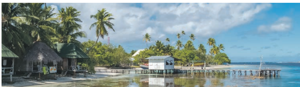
Fakarava-Atoll / Tuamotu-Archipel