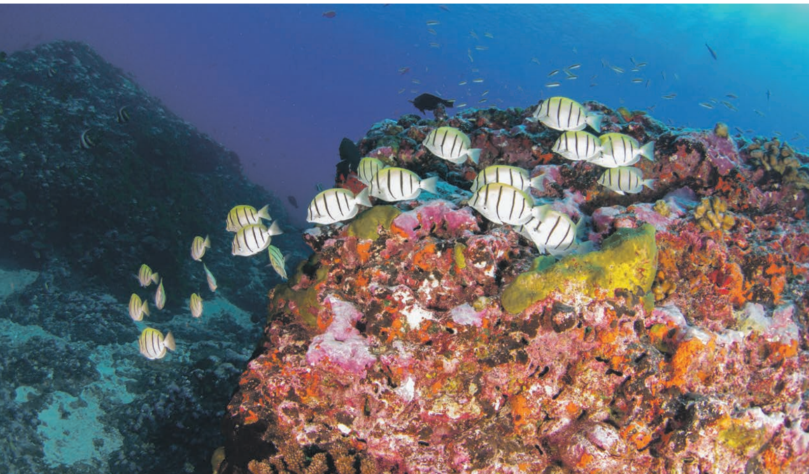
Korallenriff / Rangiroa / Tuamotu-Archipel