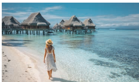
Moorea / Gesellschaftsinseln