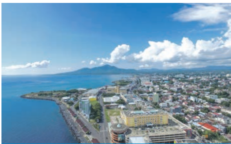
Manado / Indonesien