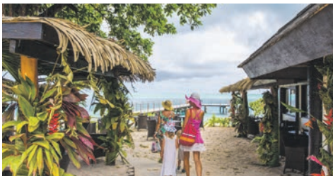
Huahine / Gesellschaftsinseln

Heute passieren Sie die Datumsgrenze und überspringen damit einen Tag.