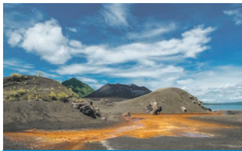
Vulkanlandschaft / Papua-Neuguinea