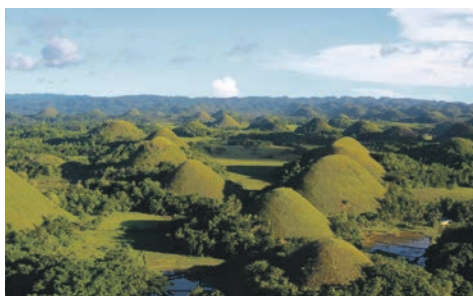
Schokoladenberge Bohols / Philippinen