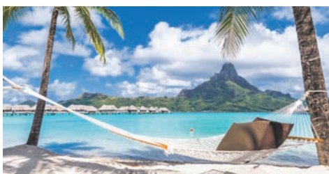
Bora Bora / Gesellschaftsinseln

Lassen Sie sich von der noch traditionellen Lebensweise der Samoaner in Apia in eine andere Welt entführen. Ob bei einem (optionalen) Ausflug in die Regenwälder im Hinterland der Insel oder auf den Spuren von Robert Louis Stevenson, hier ist für jeden etwas dabei.