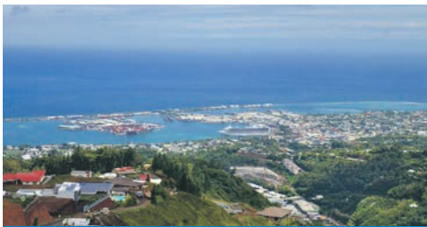
Papeete / Tahiti

Tahiti – Gesellschaftsinseln – Bora Bora – Samoa – Fidschi – Vanuatu – Salomonen – Papua-Neuguinea – Sulawesi – Bohol – Philippinen