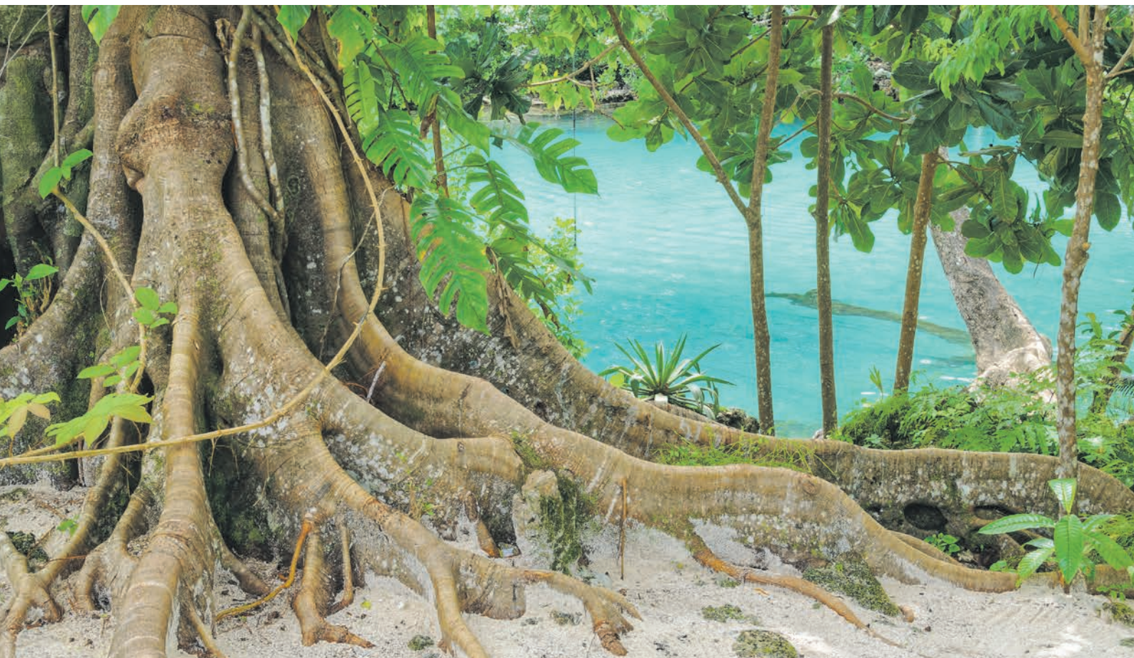
Riesige Wurzeln in der Blauen Lagune – Vanuatu