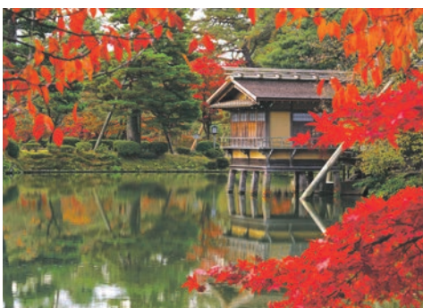
Kenrokuen Garten / Kanazawa / Japan