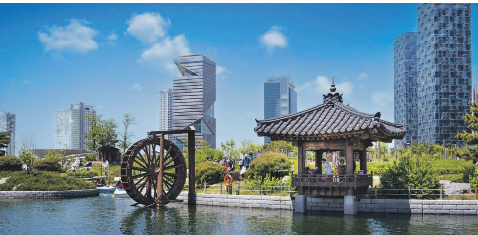
Incheon / Seoul / Südkorea