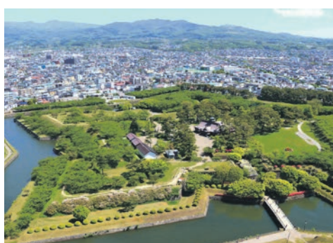
Goryokaku Fort/ Japan