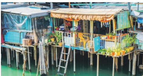
Haus in Tai O / Insel Lantau

Freuen Sie sich auf eine abwechslungsreiche Auszeit auf See.