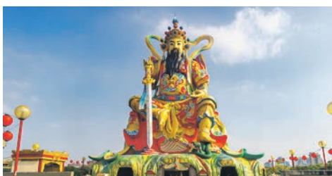
Kaohsiung / Taiwan