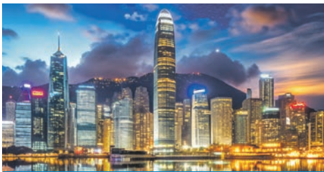
Honkong / China

Philippinen – China – Taiwan – Südkorea – Japan